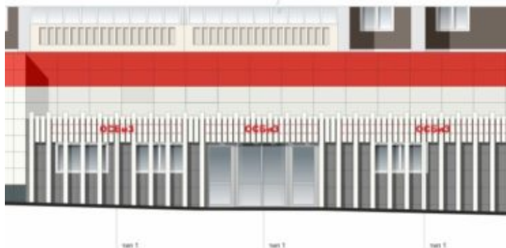
таб. 2 - настенная конструкция - объемные световые буквы и знаки с внутренней подсветкой, H до 300 мм